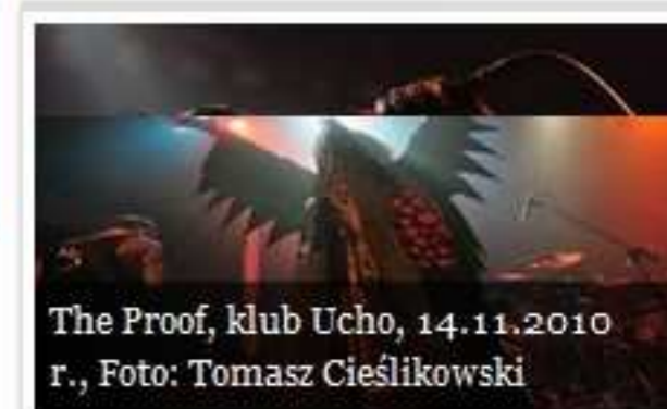
The Proof, klub Ucho, 14.11.2010 r.